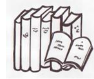
Büchern + Lehrmitteln