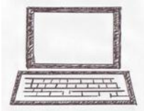
PC - Software